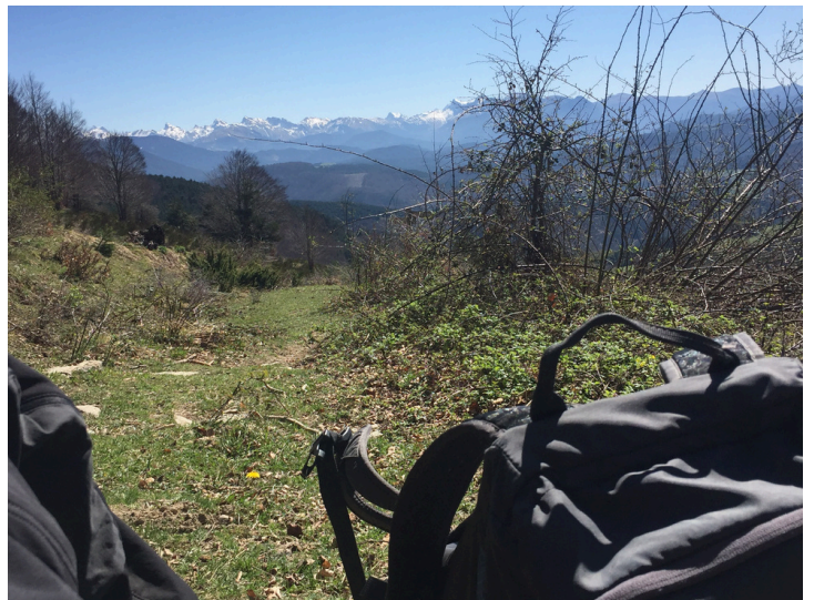
Ur-jauzia Elkorretaren inguruetan