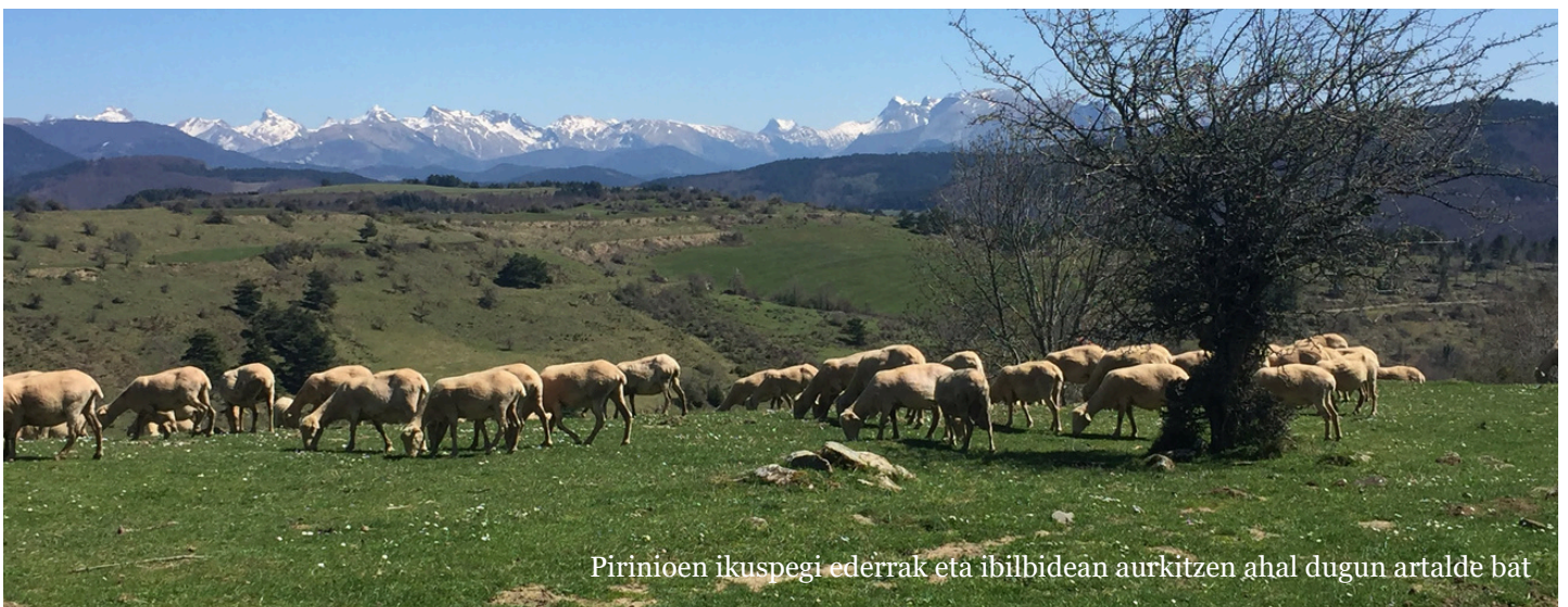
Pirinioen ikuspegi ederrak eta ibilbidean aurkitzen ahal dugun artalde bat

Itzaltzu (Salazar) será el inicio de nuestro recorrido. Nos adentraremos en el valle de Salazar. Nuestro camino se extenderá entre verdes prados y hermosos bosques de Irati. Podremos ver varias cascadas así como en unos cuantos sitios buenas vistas al Pirineo. Recordando la leyenda del bardo Gartxot que vivió en estos parajes, llegaremos a la cueva de Elkorreta. Después nos acercaremos en nuestro recorrido a las cimas del monte Abodi, y tras recorrerlas en parte, bajaremos a la ermita de Muskilda, de Ochagavía.