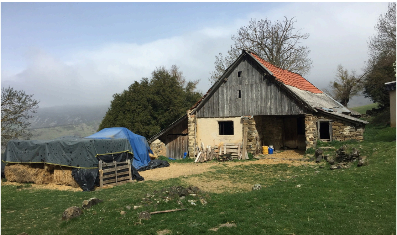
Borda Xubri en nuestra bajada hacia Muskilda

Retrocedemos, hacia el collado que hemos pasado y nos dirigimos hacia la cima de Gaztanbidea , en la sierra de Abodi. Continuaremos por la cresta hacia la cima de Abodi y desde aquí emprenderemos el descenso hacia Muskilda .