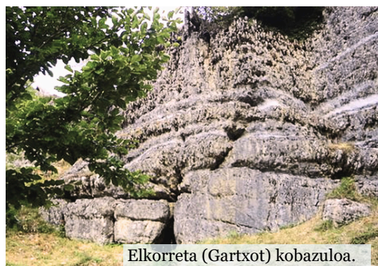
Elkorreta (Gartxot) kobazuloa.